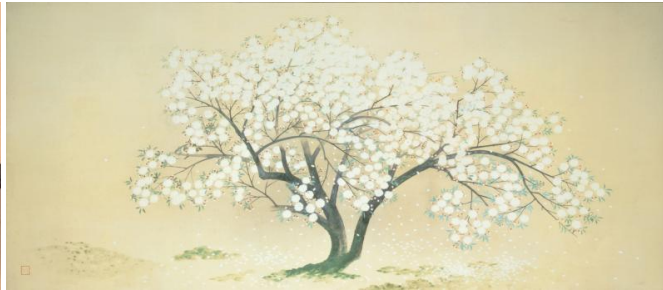
小林古径 《清姫のうち「入相桜」》 1930(昭和5)年 紙本・彩色 山種美術館