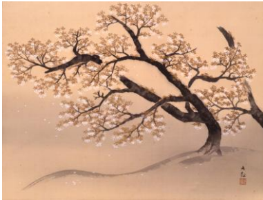
横山大観 《山桜》 1934(昭和9)年 絹本・彩色 山種美術館