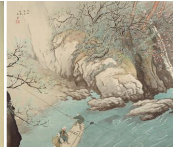
川合玉堂 《春風春水》 1940(昭和15)年 絹本・彩色 山種美術館