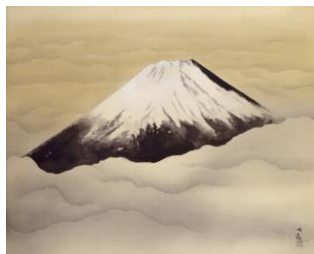
横山大観《心神》1952(昭和27) 年 絹本・墨画淡彩 山種美術館