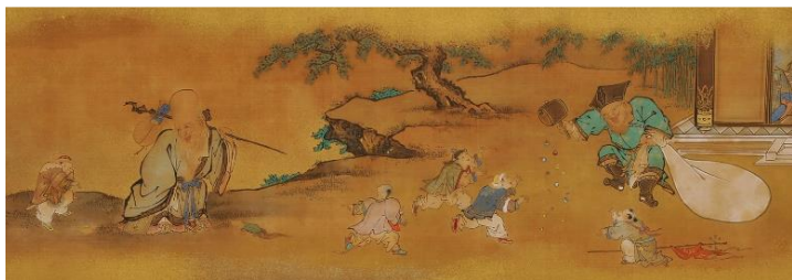
狩野常信《七福神図》(部分) 17-18世紀(江戸時代) 絹本・彩色 山種美術館【会期中巻替】