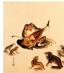
柴田是真《墨林筆哥》 1877-88(明治10-21)年 紙本・漆絵 山種美術館